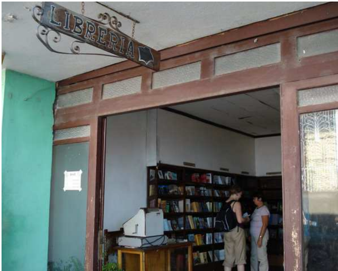
Librairie à Trinidad, Cuba

Document à l'usage des élèves et du corps enseignant de l'EPCL