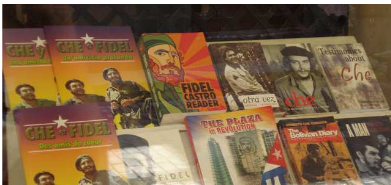
Vitrine d'une librairie à la Havanne, Cuba